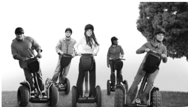
rijden met de Segway

Wil je van richting veranderen? Leun opzij en hij gaat de bocht om.